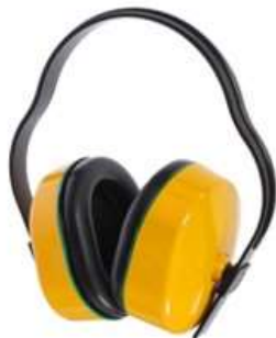
3) Защитная маска